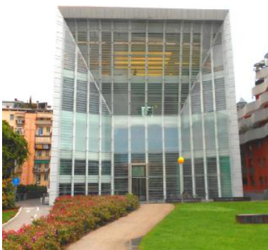
L'architettura è un parallelepipedo lungo 25 metri, largo 23 e alto 54

le, pop, poesia visiva, body art, pittura-scultura, libri d'artista, fotografie, installazioni luminose, tanti i linguaggi espressivi che si ricorrono nei due piani dell'esposizione, nei quali le opere delle due collezioni, di Museion e di Ingvid Goetz sono in continua relazione. La mostra si apre con l'arazzo caleidoscopico "Tutto" di Alighiero Boetti fronteggiante un "Concetto spaziale" di Lucio Fontana. Apertura, espansione, superamento della bidimensionalità nelle estroflessioni di Agostino Bonalumi, immagini in bilico tra pittura e scultura che tendono alla conquista dello spazio con un gioco di sporgenze e rientranze. Non elementi informali nelle