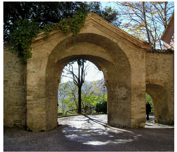
Panorami immensi che accompagnano lo sguardo dal monte al mare. Lusinghe per l'occhio. Per chi le sa apprezzare.