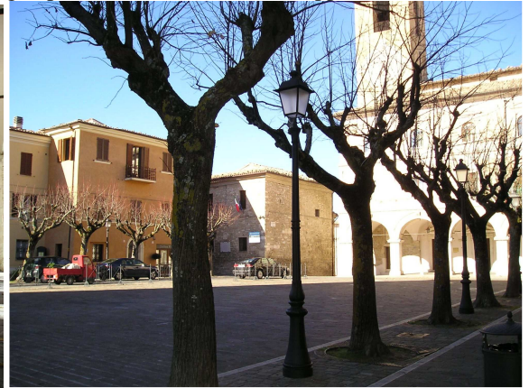
Ecco un altro borgo marchigiano perfetto per fuggire dal caos cittadino, dalle spiagge chiassose, dalla vita metropolitana.