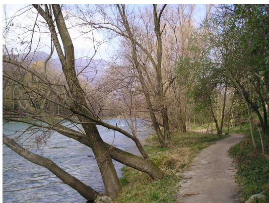
Vedi articolo “Scoprire il Brenta”

10 km. di passeggiata “lungo il fiume e sull’acqua” .Si parte a piedi o in bici da Bassano del Grappa. Al Ponte Vecchio, di fronte la storica Grapperia Nardini s’imbocca Via Pusterla e avanti , contro corrente fino alla passerella di Campese. Qui s’inverte la rotta e si ritorna in città sulla Destra Brenta camminando sull’argine rinforzato dai “murazzi”. Una camminata a fianco di un fiume dalle acque vivaci, chiacchierine, perfino monelle.