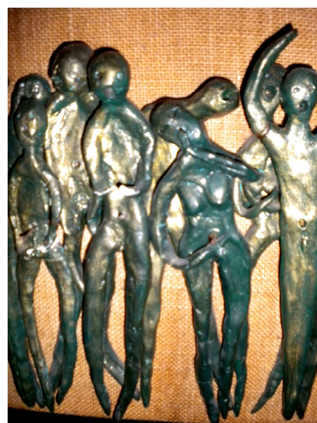
Scultura di Silvano Terzo Testo di Cinzia Albertoni

Neppure un pubblico per così tanta supplicante teatralità .