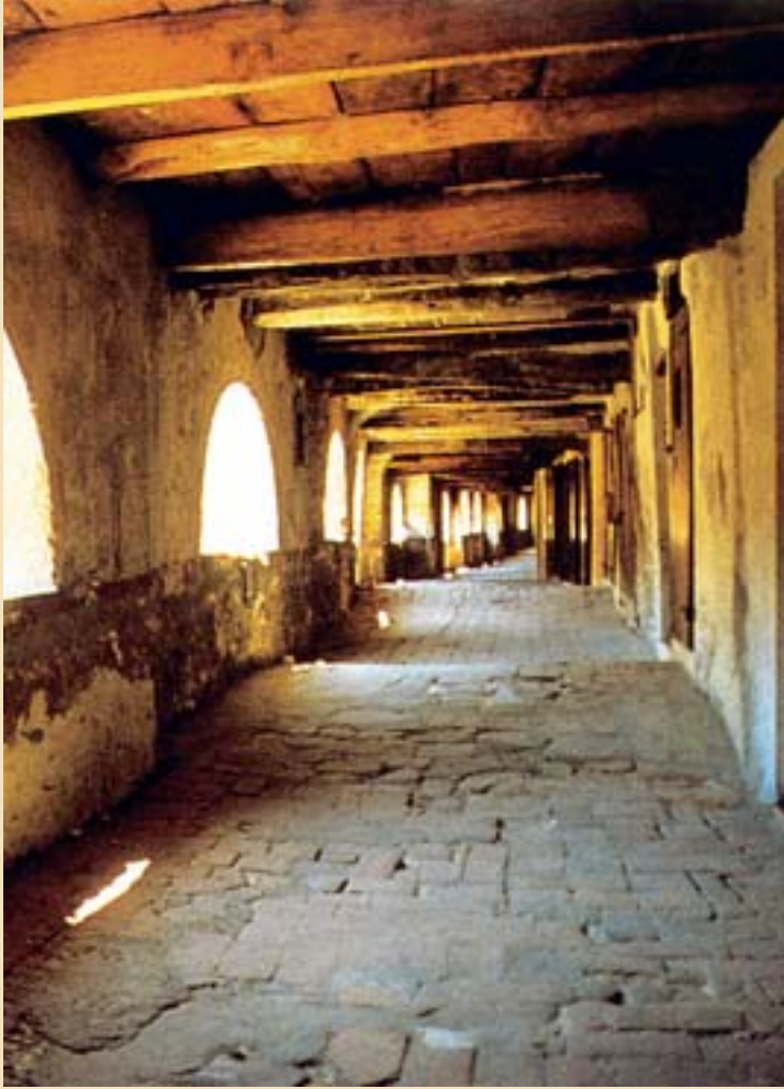
La Via degli Asini a Brisighella, ad un piano rialzato

PASSEGGIATA. Dall'imbocco della Via degli Asini, un sentiero gradonato sale al colle della Torre dell'Orologio, fortitizio difensivo risalente al 1290 e ridimensionato nella forma attuale nel 1850. Da questo punto panoramico si ammirano il saliscen-