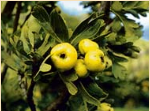
Le pere volpine: la sagra si tiene il 12 novembre