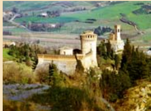
La Rocca Manfrediana

INFO. Ufficio IAT in Piazzetta Porta Gabolo, 5. Tel. 054681166. www.comune.brisighella.ra.it.