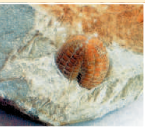
Uno dei fossili rinvenuti dalla cava.

MONTE GEMOLA. Superata la chiesa di Cinto si prosegue in auto e si sale sul Monte Gemola per visitare l'antico monastero di Villa Beatrice d'Este, un luogo che il paesaggio, il silenzio e la sua storia rivelano estremamente affascinante. Qui nel 1221, restaurando i resti di un primitivo convento abbandonato, visse insieme alle sue compagne la monaca Beatrice dell'illustre casata degli Estensi. Il convento fu attivo fino al 1578 e dopo la sua soppressione fu messo in vendita; acquistato nel 1657 dall'orafa veneziana Francesco Rubertis fu da questi trasformato in dimora patrizia. Attualmente il complesso appartiene alla Provincia di Padova che dopo accurate ricerche e restauri ne ha fatto sede di un museo naturalistico che consente di intravedere ancora oggi tracce dell'antico monastero. L'edificio attuale mostra una facciata che suggerisce una certa severità monastica per il parsimonioso uso degli elementi decorativi limitati alle cornici di porte e finestre, alla balaustra del balcone e all'ac-