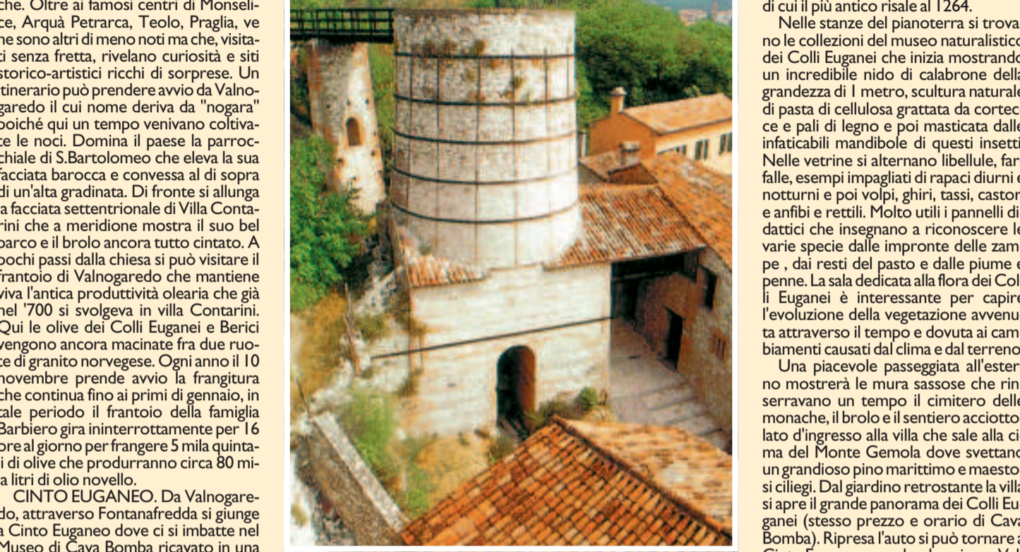
di Cinzia Albertoni

Per correndo la Riviera Berica in uscita da Vicenza verso Novent, indirizzando lo sguardo a sud-est si vedono i Colli Euganei elevarsi dalla pianura con le loro forme coniche. Oltre ai famosi centri di Monselice, Arquà Petrarca, Teolo, Praglia, ve ne sono altri di meno noti ma che, visitati senza fretta, rivelano curiosità e siti storico-artistici ricchi di sorprese. Un itinerario può prendere avvio da Valnogaredo il cui nome deriva da "nogara" poiché qui un tempo venivano coltivate le noci. Domina il paese la parrocchiale di S. Bartolomeo che eleva la sua facciata barocca e convessa al di sopra di un'alta gradinata. Di fronte si allunga la facciata settentrionale di Villa Contarini che a meridione mostra il suo bel parco e il brolo ancora tutto cintato. A pochi passi dalla chiesa si può visitare il frantoio di Valnogaredo che mantiene viva l'antica produttività olearia che già nel '700 si svolgeva in villa Contarini. Qui le olive dei Colli Euganei e Berici vengono ancora macinate fra due ruote di granito norvegese. Ogni anno il 10 novembre prende avvio la frangitura che continua fino ai primi di gennaio, in tale periodo il frantoio della famiglia Barbiero gira ininterrottamente per 16 ore al giorno per frangere 5 mila quintali di olive che produrranno circa 80 mila litri di olio novello.