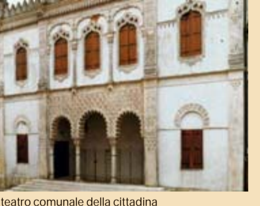
Il teatro comunale della cittadina