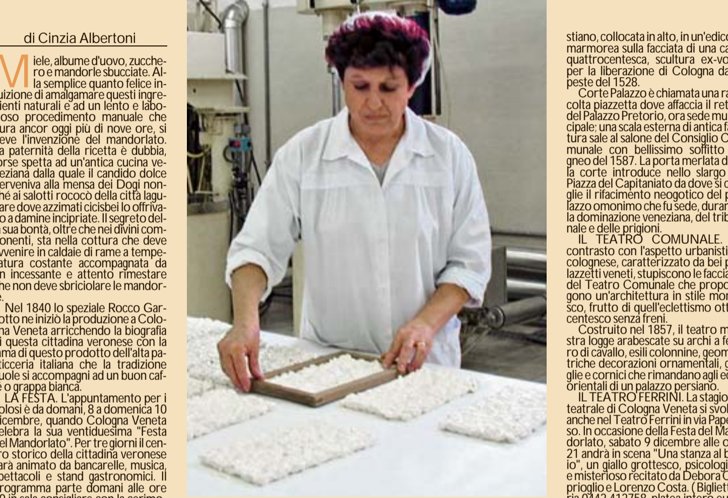
La lavorazione del mandorlio a Cologna Veneta