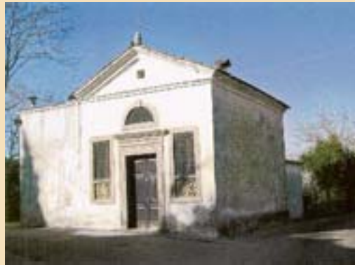
La cappella della Madonna del Torniero

SAI PIETRO IN CASTELVECCHIO. Poiché le fortificazioni medioevali a Montecchio Precalcino erano due, scendendo dalla Bastia si può raggiungere la piccola altura dove esisteva il Castelvecchio e dove si può visitare la chiesetta campestre di San Pietro (aperta la domenica). Il castello qui eretto nel X secolo fu distrutto nel 1313 dai Padovani che risparmiarono invece la chiesa allora già esistente.