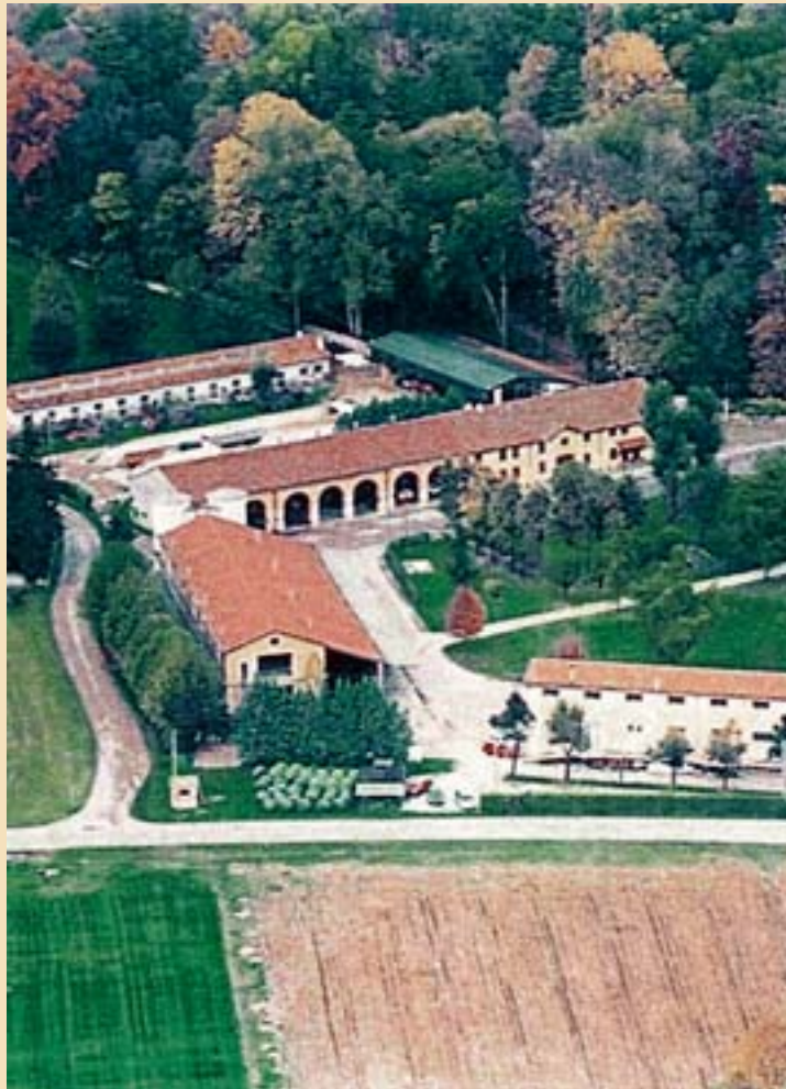
Da visitare l'Azienda agricola sperimentale della Provincia di Vicenza

Probabile testimonianza di un vulcano estinto è il colle di Montecchio Precalcino che si erge solitario poco più a nord di Dueville. Per difenderlo dalle piene distruttive dell'Astico già in epoca romana vi fu innalzato uno sbarramento e un ulteriore "murazzo" venne eretto tra il 1507 e il 1532 ancora oggi visibile nei pressi della scuola materna.