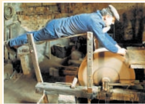
Un momento della lavorazione alla mola

Per chi desidera partecipare sono aperte le iscrizioni al 339 - 8688783.