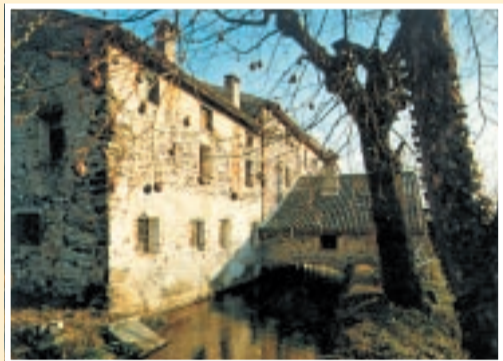
Roggia e maglio di Breganze visti dal lato nord