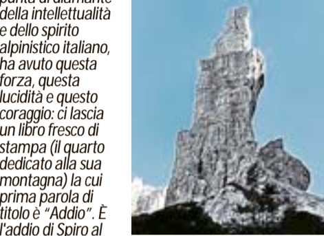
Montanaja, il razzo di pietra che egli sente ormai di non poter più raggiungere, di non poter più sfiorare con le mani...