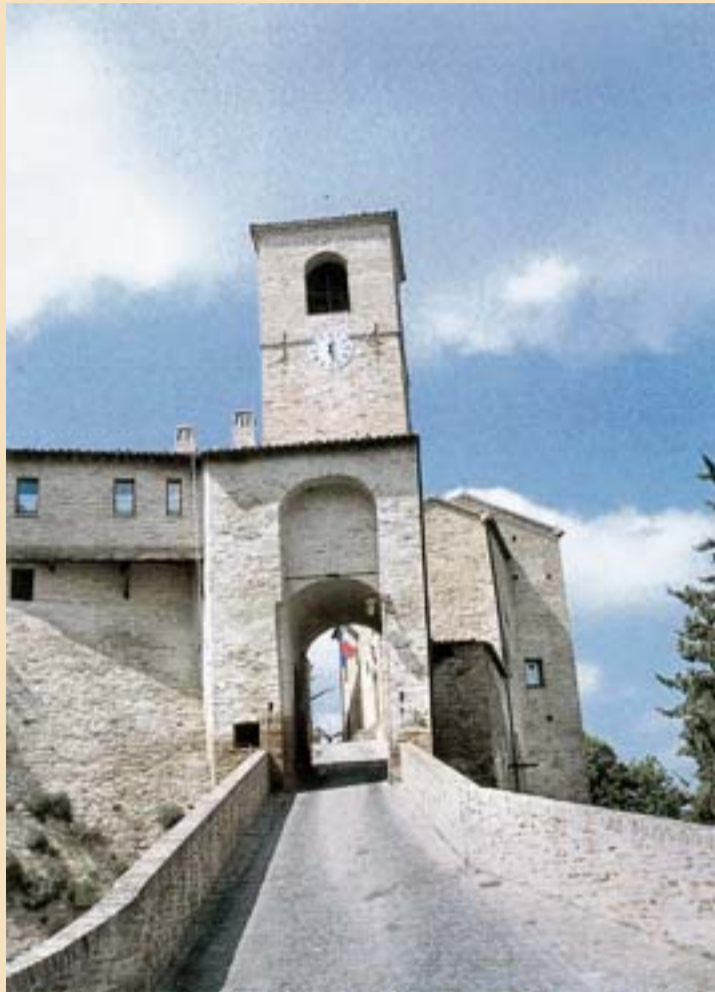
La porta d'accesso al borgo di Montegradolfo