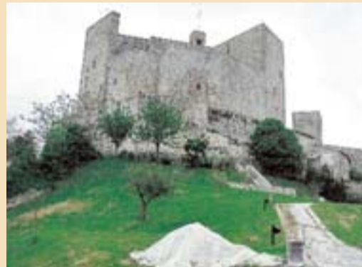
La bella rocca di Montefiore