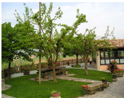
Agritur San Rocco a Villa Verucchio