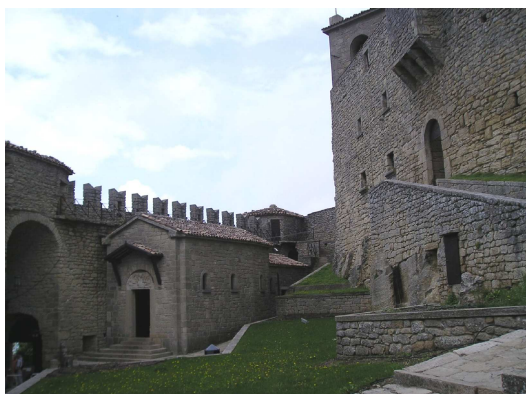
Rocca di San Marino