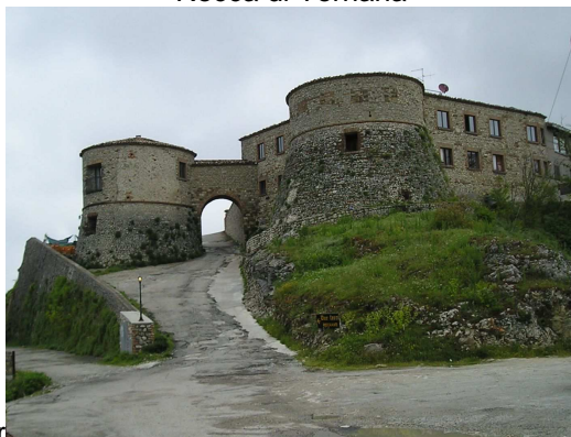
Rocca di Torriana