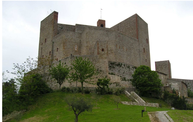
Rocca di Montefiore