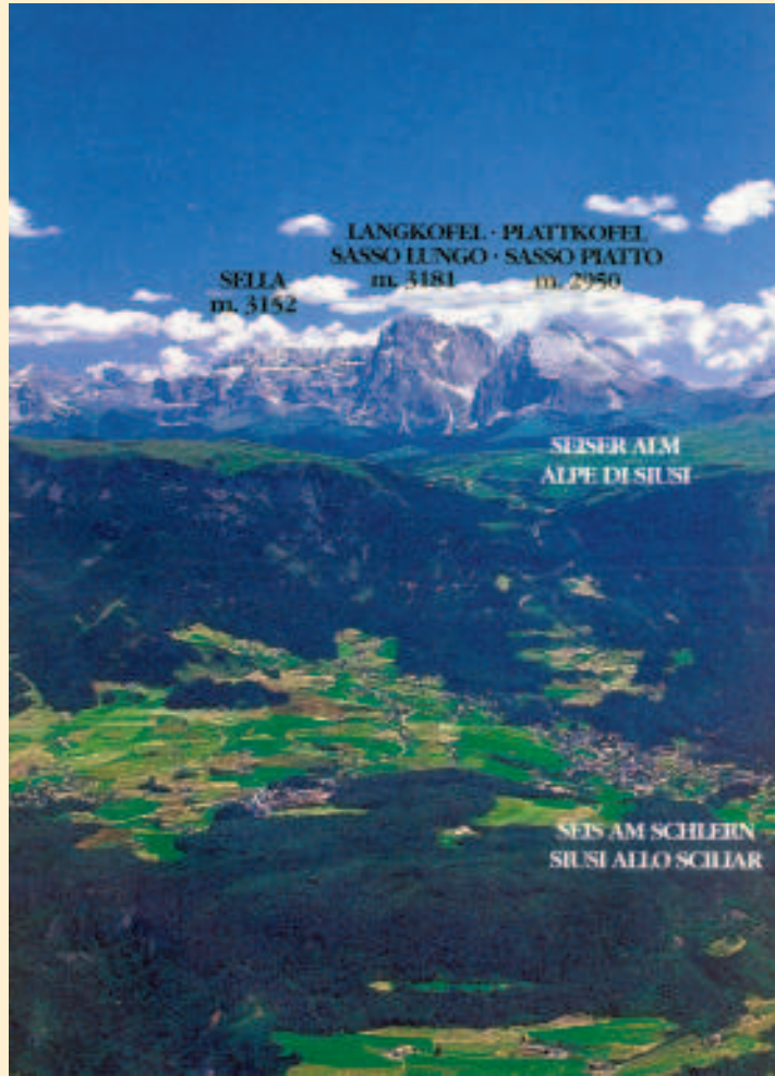
Una panoramica dell'Alpe con i paesi sottostanti l'Altopiano e le vette

una piramide irregolare di dura dolomia che contrappone il versante nord tutto torri, campanili e dirupi al versante ovest liscio e inclinato, un "gigante desnudo" intarsiato dai venti e dai ghiacci.