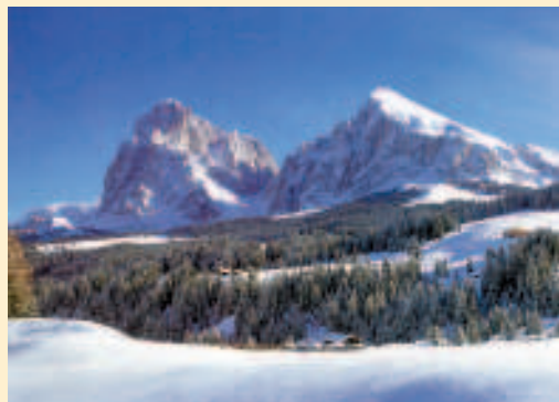
Sassolungo e Sassopiatto, spettacolo invernale